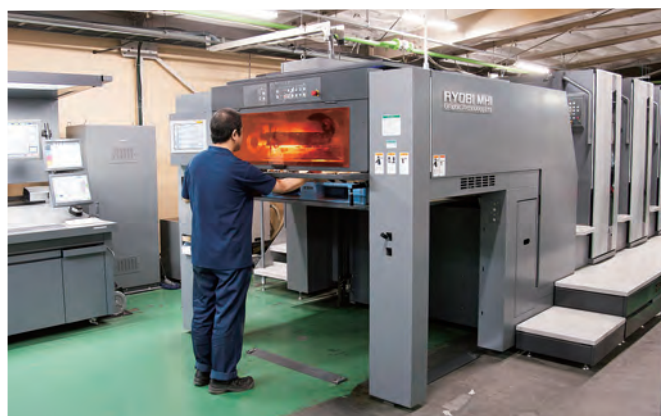
LED-UV乾燥装置搭載 菊全判オフセット印刷機 V3000 LS-4

物を納めることを基本のきとして、コストダウン、リードタイムの短縮につながる改善を営業から、製造まで全社横断的に進めてきた。また、セールスフォース社のクラウドシステムを使った営業支援システムや見積システムなどを導入し、顧客サービスの充実を図っており、さらに、製造部門では工程管理システムを導入し、製造工程の見える化を行っている。営業マンにスマートフォンをもたせ、工程管理システムにアクセスさせることで、出先でも受注業務の進捗状況や、機械の空き状況が一目でわかり、お客様へのスピーディな対応を可能にしてきた。