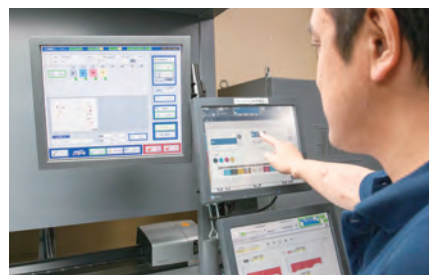
DIAMOND EYE-S の導入で、不良品の発生を未然に防止。

最小限に抑える生産計画を立案するなど、現場のワークフロー改善も併せて行うことで、大きな相乗効果を出せているという。